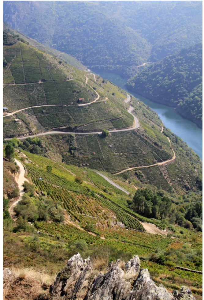
Viñedos desde o miradoiro da Pena do Castelo (Doade-Sober)

Un tramo do río está protexido no LIC "Canóns do Sil".