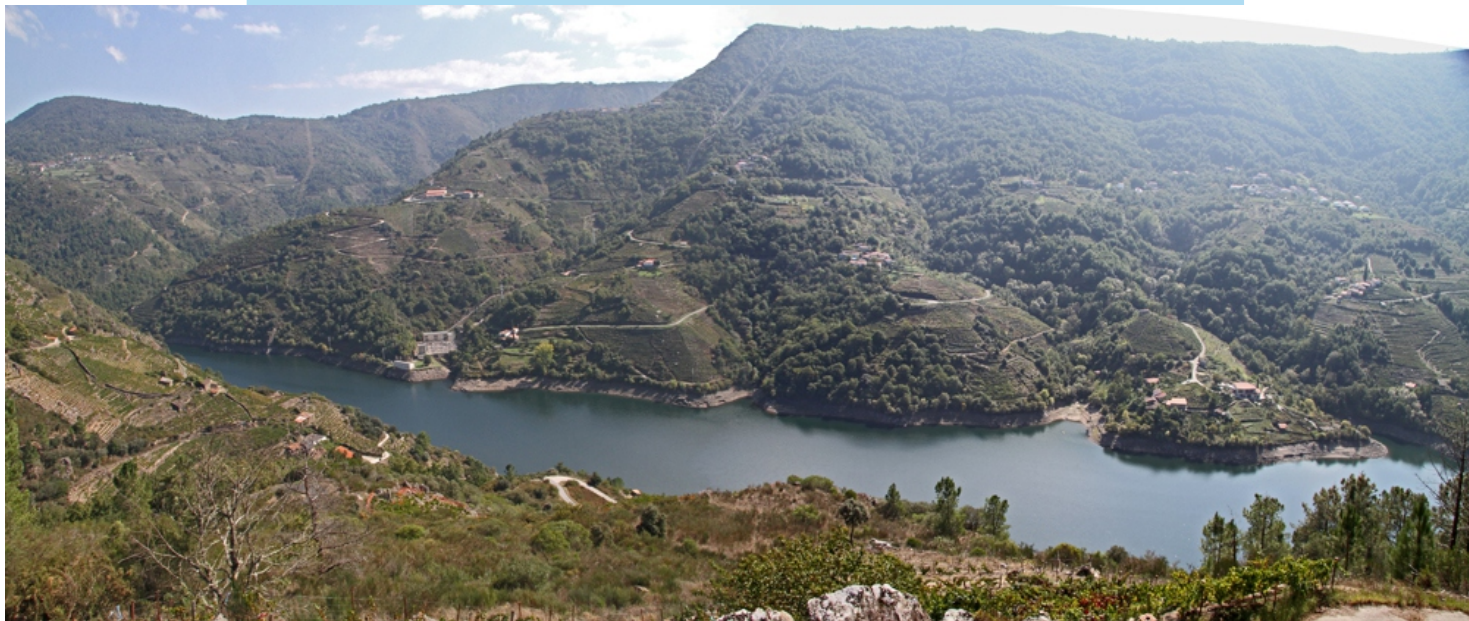
Vista desde Os Chelos (Amandi-Sober).