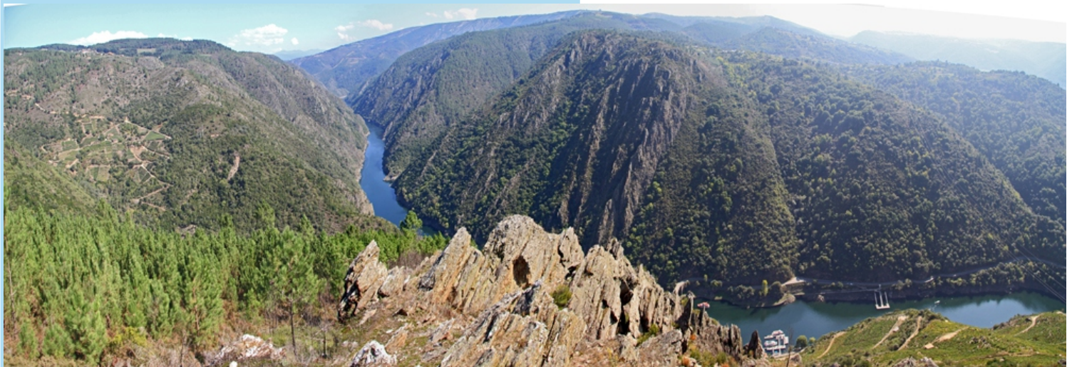
Panorámica desde o miradoiro do Duque (Palleiros-Monforte de Lemos)