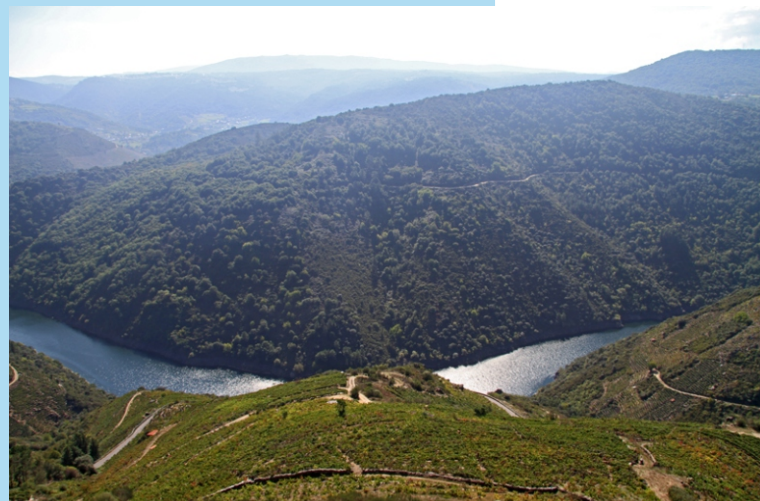
Vistas desde o miradoiro da Pena do Castelo (Sober)