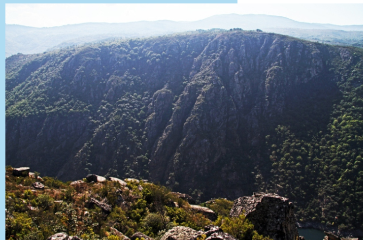
Vistas desde o miradoiro do santuario das Cadeiras (Píno-Sober).