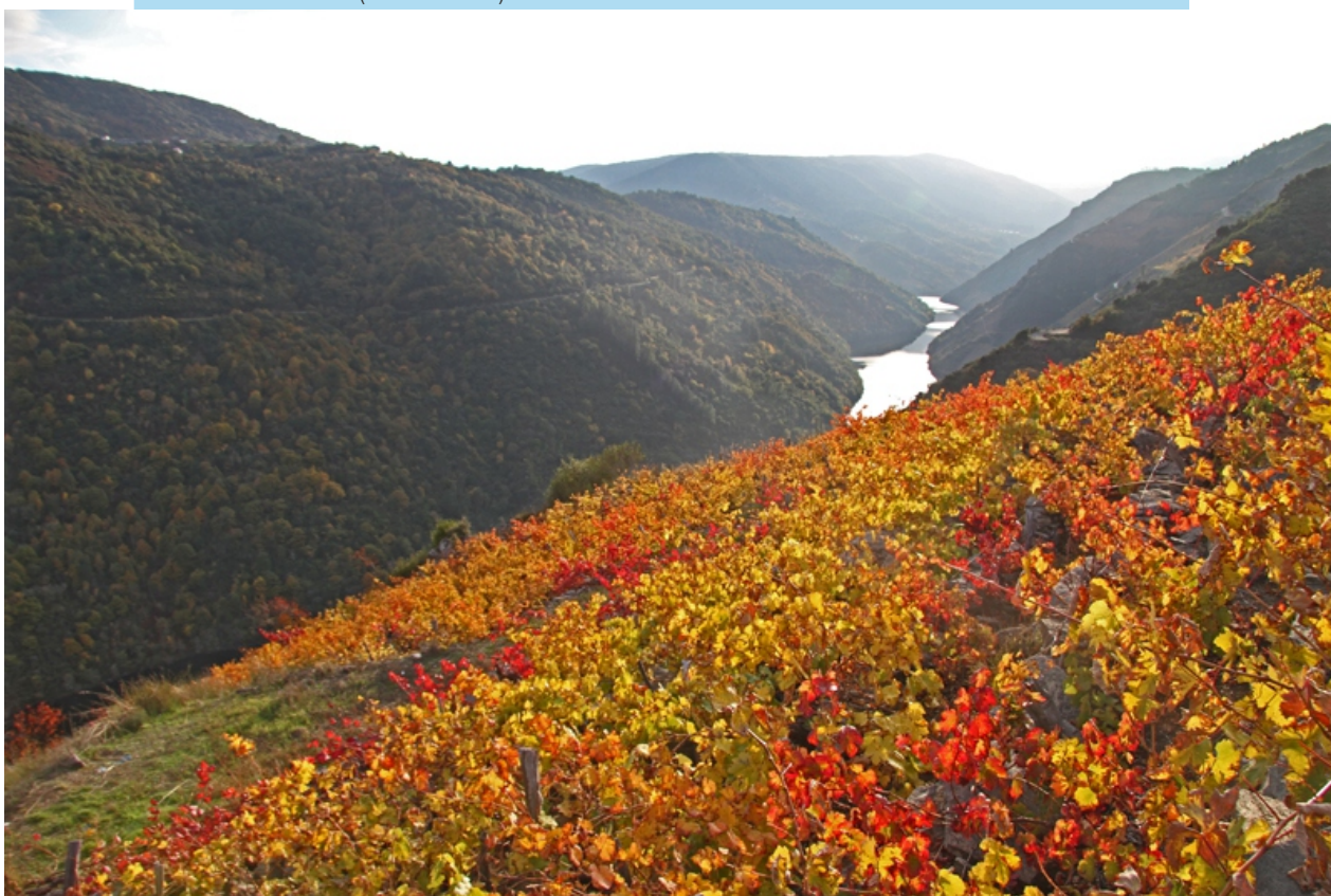
Vista desde o miradoiro de Soutochao ou da Ribeira Sacra (Doade-Sober).