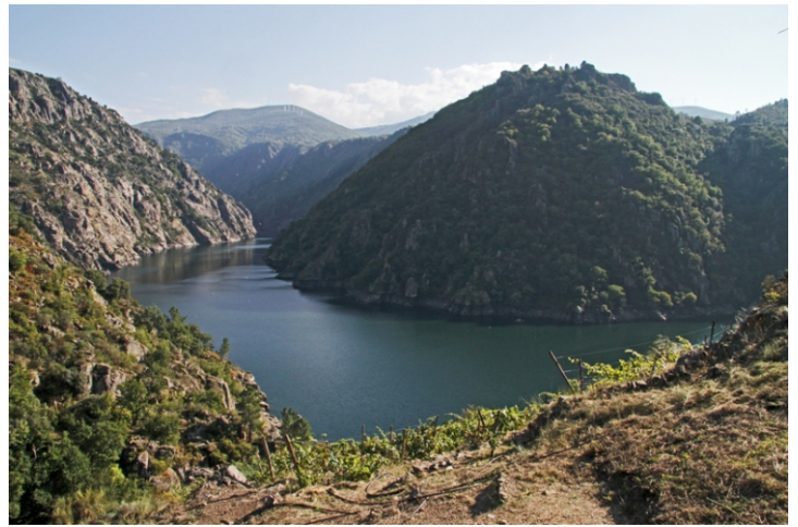
Miradoiro de Xabrega ou dos Chancís (Sober).