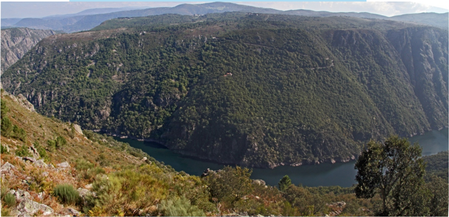
Panorámica desde o miradoiro do Boqueiriño en Bolmente (Sober). De fronte o bosque no que se atopa o mosteiro de santa Cristina de Ribas de Sil.