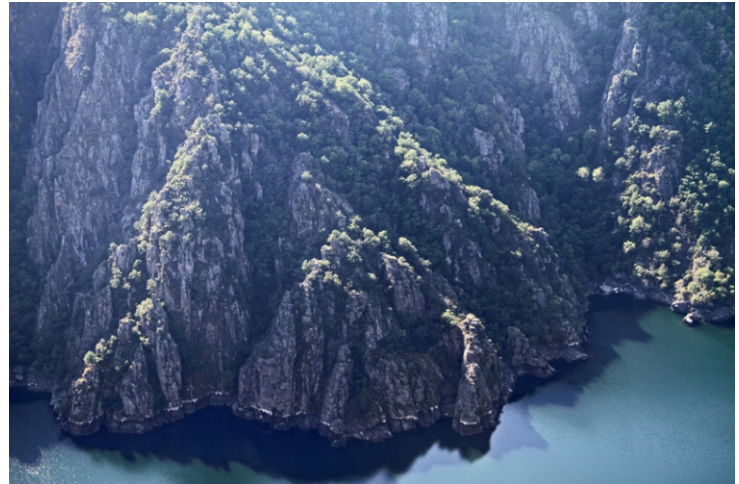
Detalle das paredes do canón desde o miradoiro da Cividade en Bolmente (Sober), chamado así pola presenza dun castro nas proximidades.