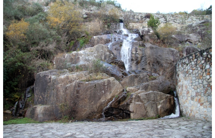
Ferverza no rego de Camilo nos Chancís (Sober).