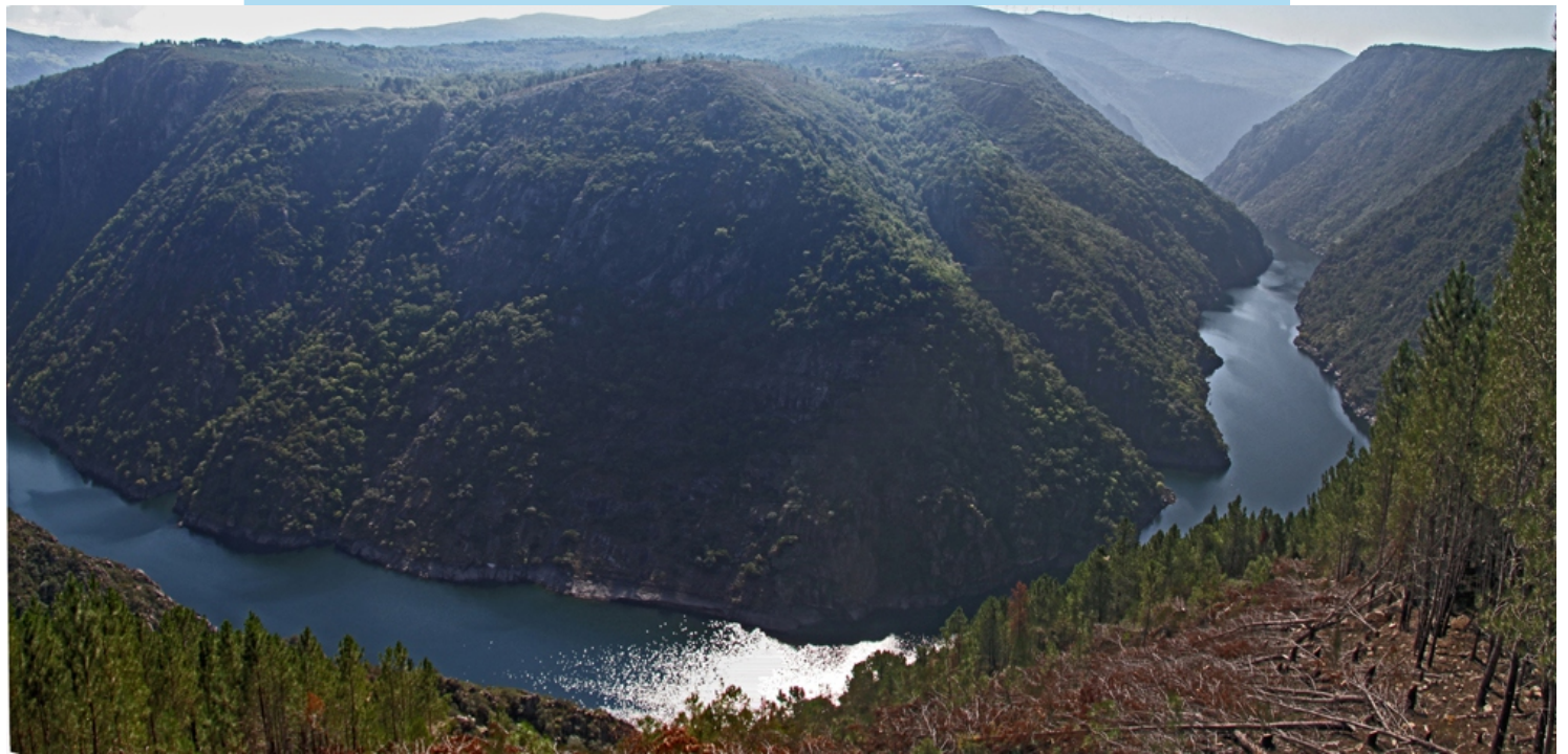
Canón do Sil desde o mirador de Santiorxo (Sober).