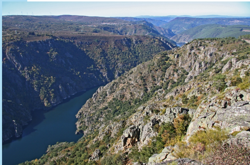
Miradoiro da Cividade en Bolmente (Sober).